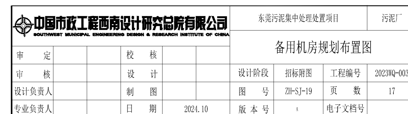
备用机房规划布置图